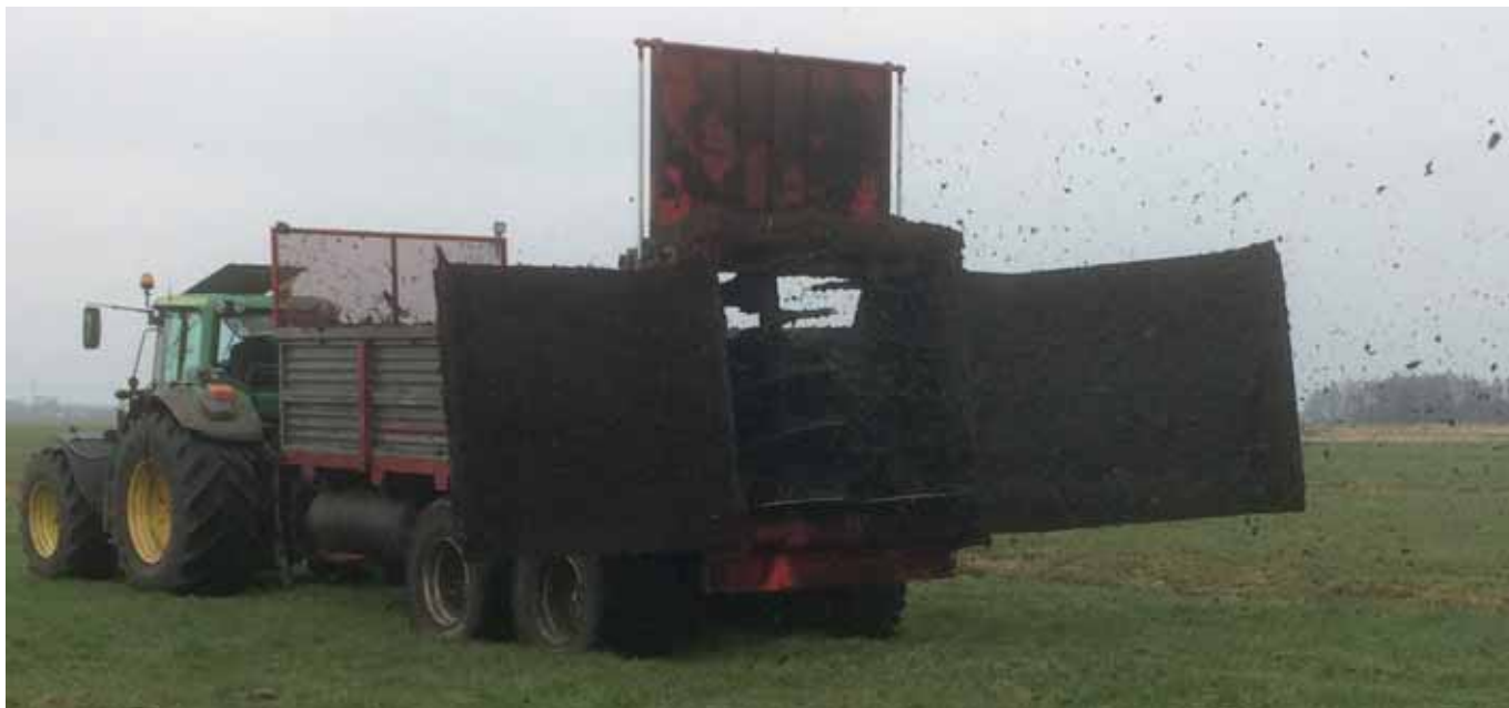
FIGUUR 3: KLEITOEPASSING IN HET VELD.

Kleigrond en -bagger met voor dit doel geschikte eigenschappen moet van buitenaf worden aangevoerd. Ieder jaar verplaatsen we in Nederland 80 miljoen ton grond en bagger, we zijn dus goed in de logistieke aspecten die daar normaal gesproken bij komen kijken. De uitdaging voor de veenweidegebieden zit in de beperkte draagkracht van de ondergrond en de capaciteit van het wegstelsel. Ook is afstemming nodig met de gewenste afvoercapaciteit.