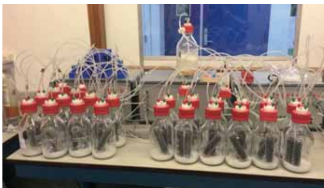
FIGUUR 2: RESPIRATIEMETINGEN AAN VEENKOLommen GEMENGD MET KLEI.

van belang zijn voor de binding van organische stof in veengrond.